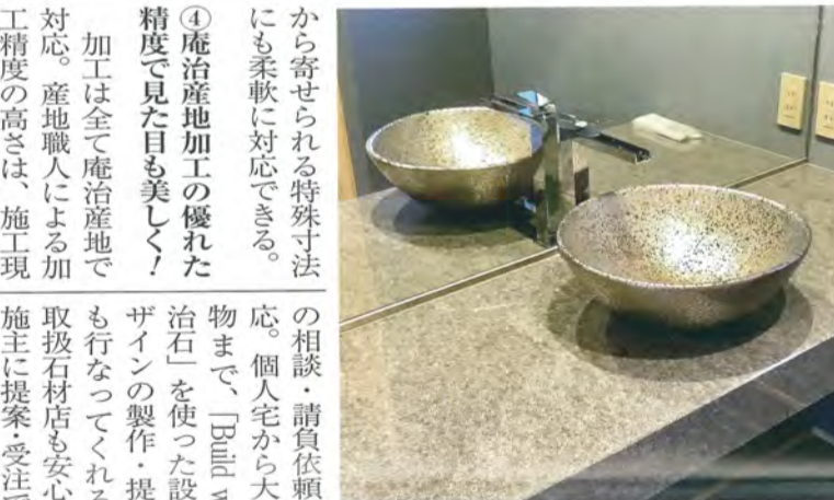
洗面ボールとよくあってお洒落に仕上がっている室内 の施工例（庵治石細目/洗面台size1450×510×120）

◆(有)石材商 太元屋 香川県高松市牟礼町牟礼 3720-360 TEL 087-845-1114 http://www.daienyap.jp/